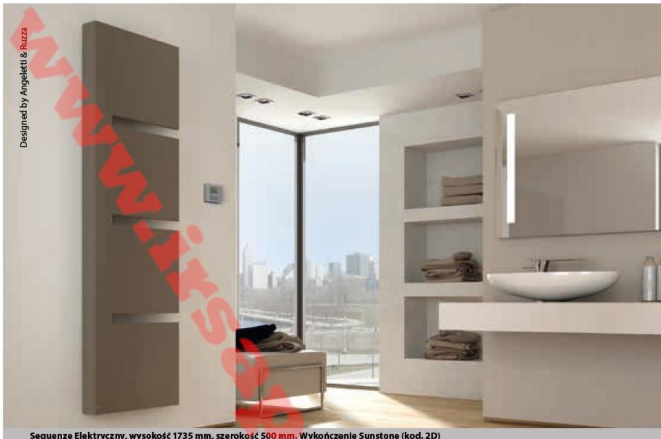
Sequenze Elektryczny, wysokość 1735 mm, szerokość 500 mm. Wykończenie Sunstone (kod. 2D)