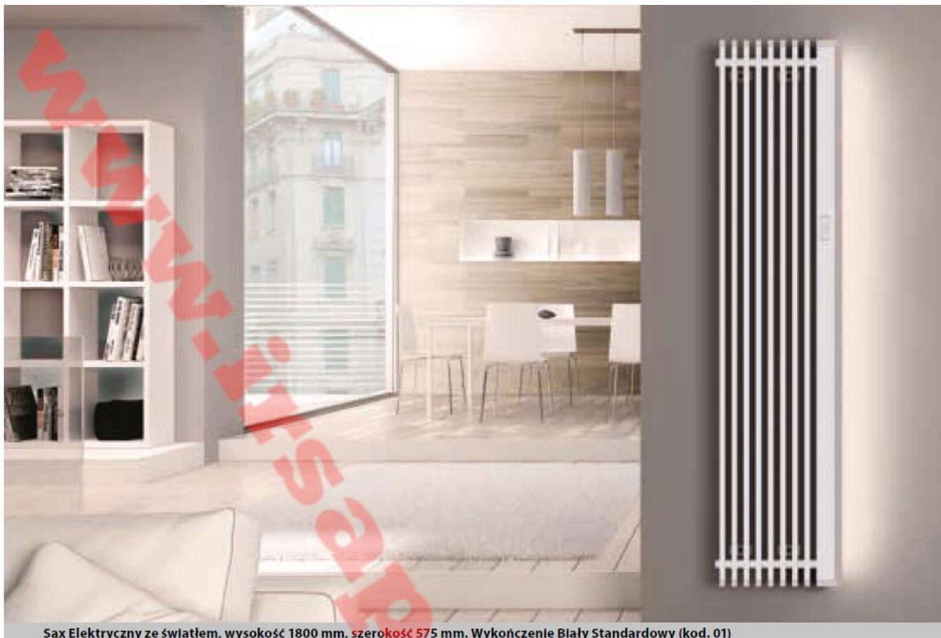
Sax Elektryczny ze światłem, wysokość 1800 mm, szerokość 575 mm. Wykończenie Biały Standardowy (kod. 01)