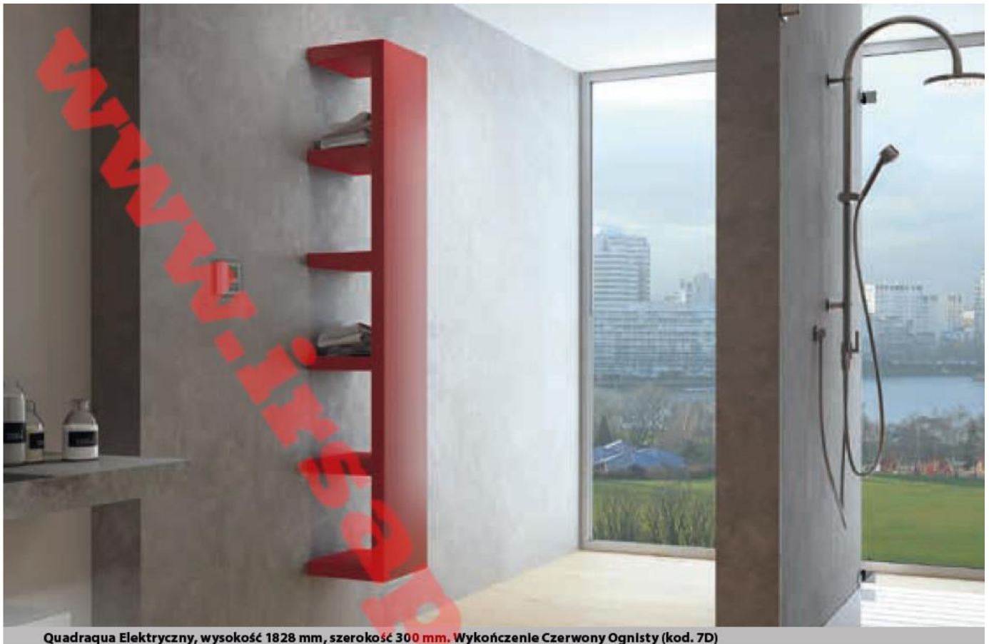
Quadraqua Elektryczny, wysokość 1828 mm, szerokość 300 mm. Wykończenie Czerwony Ognisty (kod. 7D)