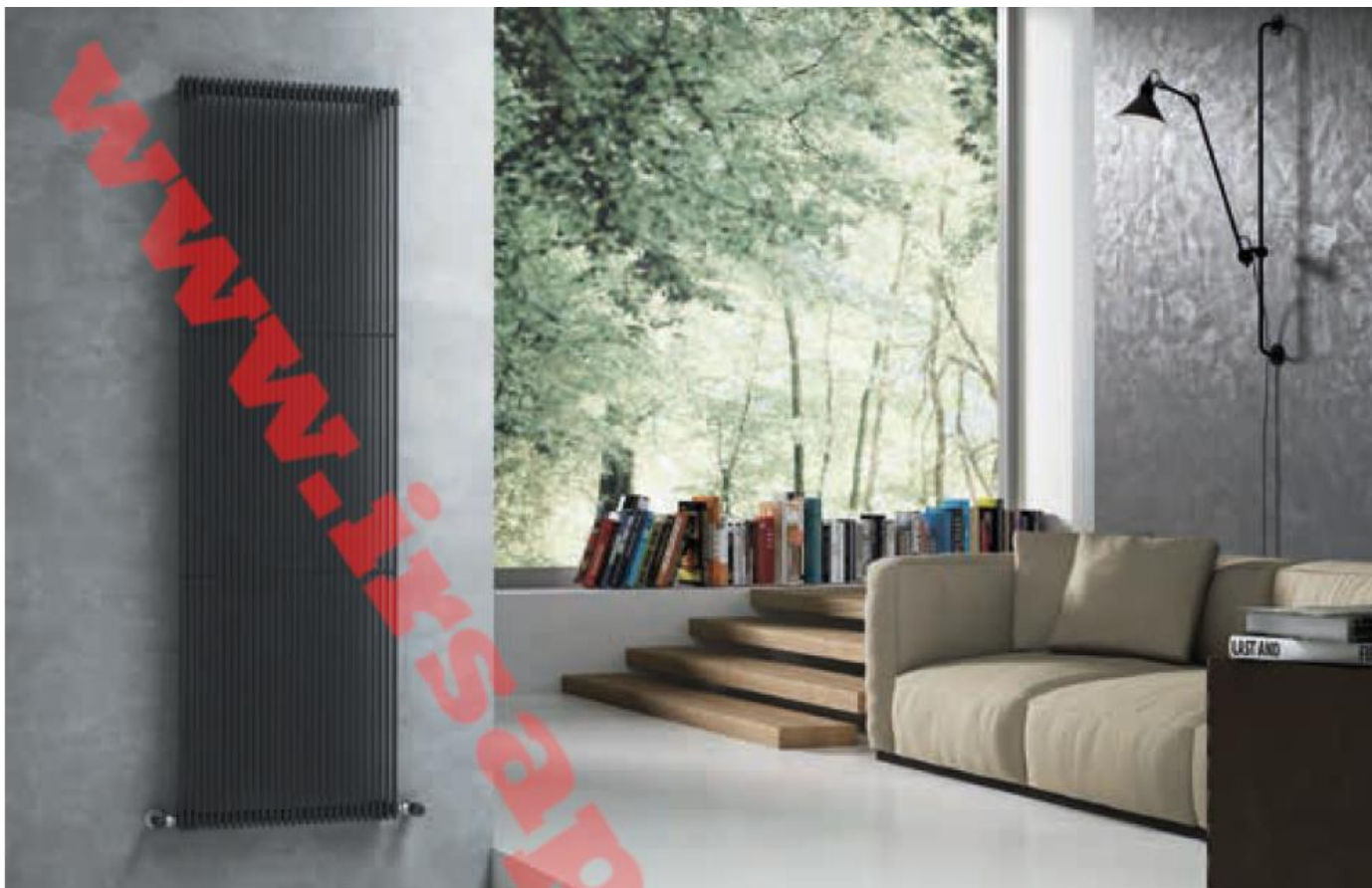
Arpa12 Pionowy, 30 elementów, wysokość 1820 mm. Wykończenie Czarny (kod. 10). Konfiguracja kod. M80.