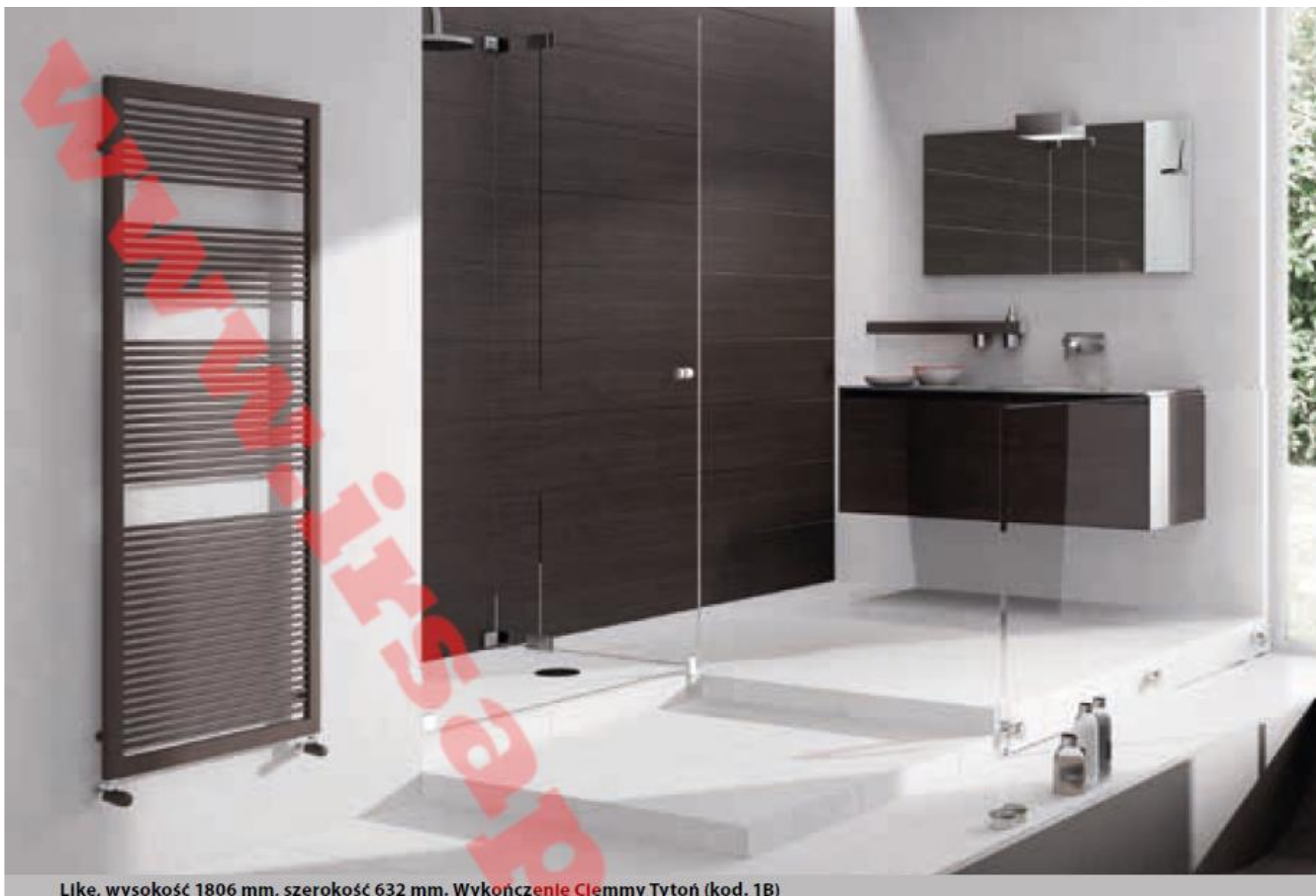
Like, wysokość 1806 mm, szerokość 632 mm. Wykończenie Clemmy Tytoń (kod. 1B)