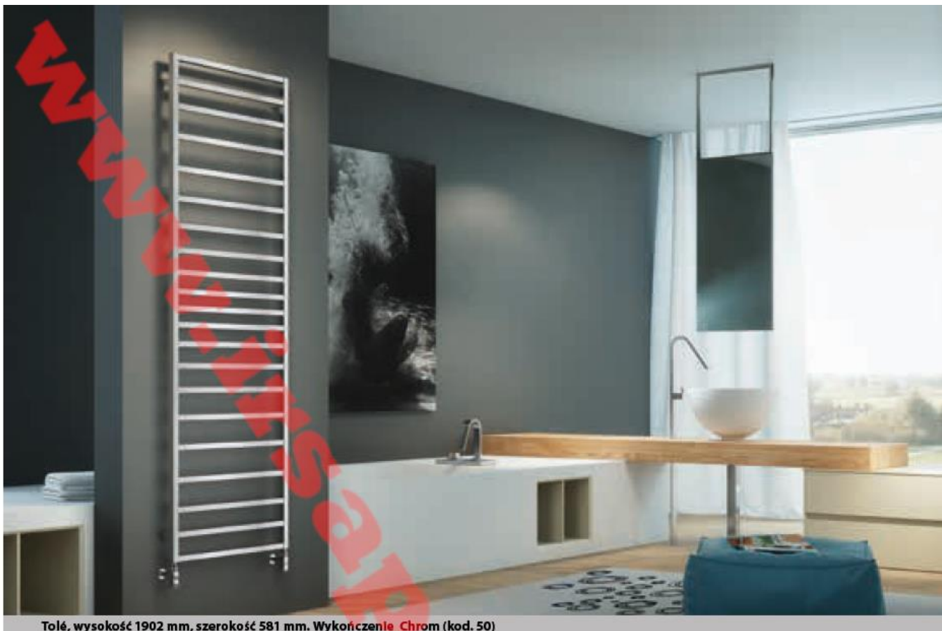
Tolé, wysokość 1902 mm, szerokość 581 mm. Wykończenie Chrom (kod. 50)