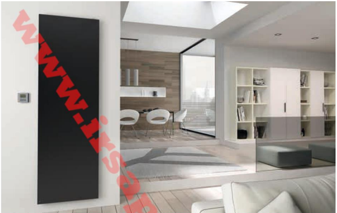
Relax Elektryczny, wysokość 1963 mm, szerokość 616 mm. Wykończenie Czarny Grafitowy (kod. 18)