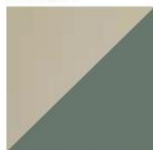
Agawa kod. 9N