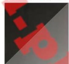
Szary Średni kod. 4D