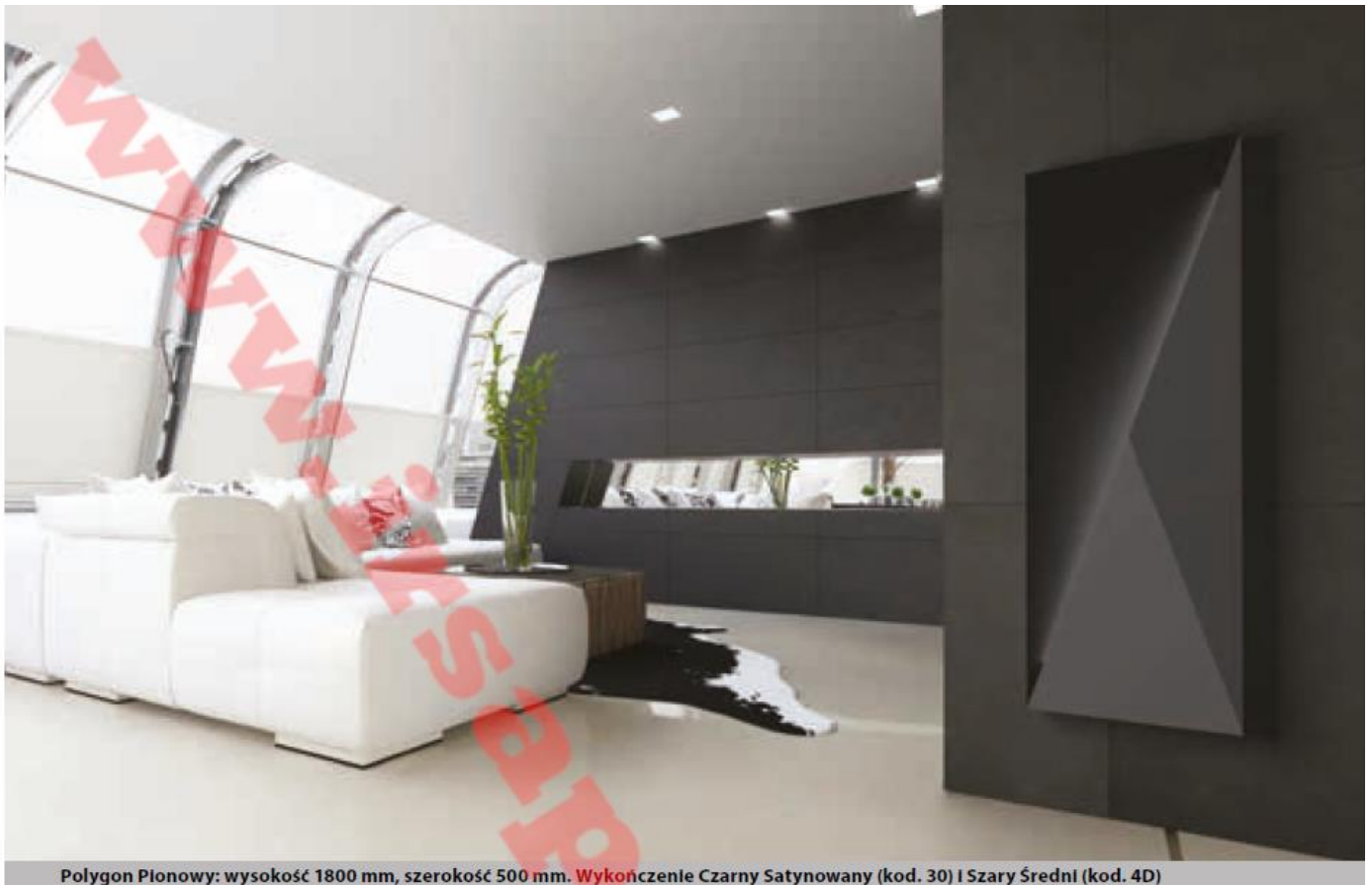
Polygon Płonowy: wysokość 1800 mm, szerokość 500 mm. Wykończenie Czarny Satynowany (kod. 30) i Szary Średni (kod. 4D)