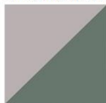
Agawa kod. 9N