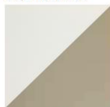
Quartz 2 kod. 2C