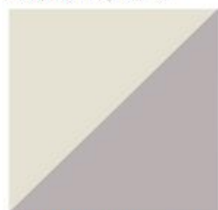
Jasnoszary matowy kod. 8N