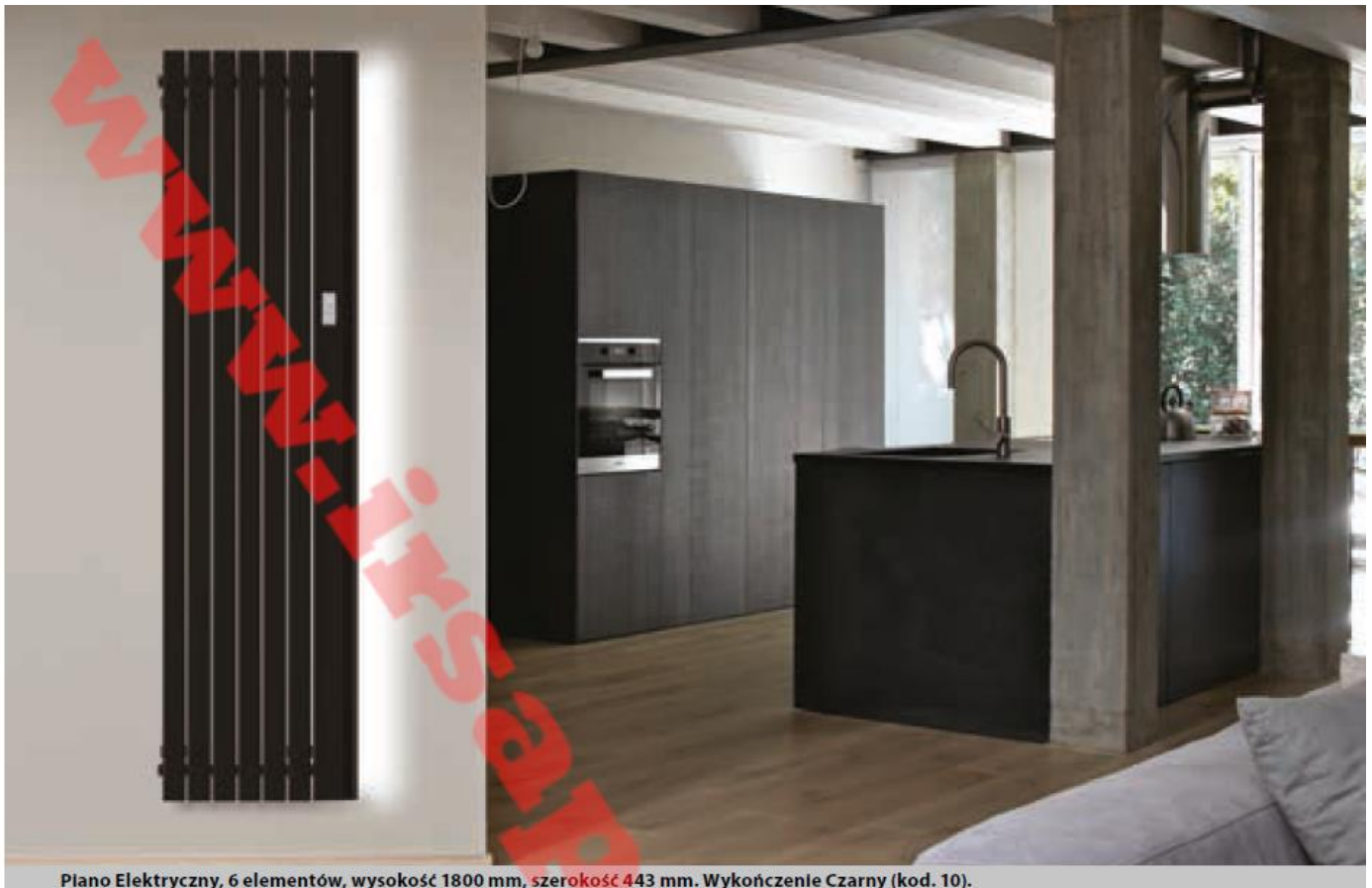
Piano Elektryczny, 6 elementów, wysokość 1800 mm, szerokość 443 mm. Wykończenie Czarny (kod. 10).