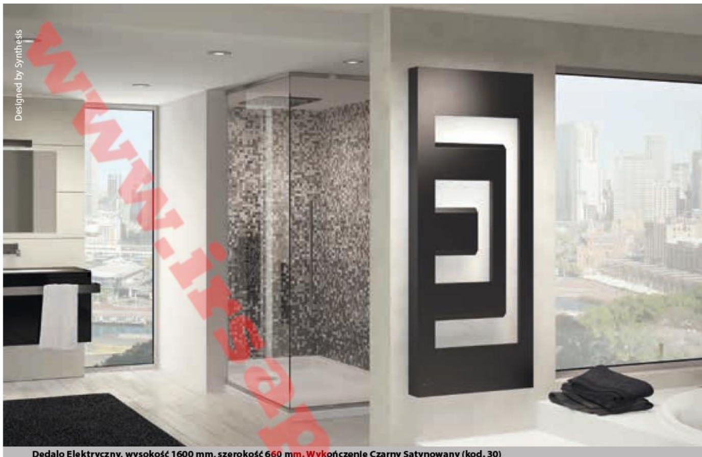
Dedalo Elektryczny, wysokość 1600 mm, szerokość 660 mm. Wykończenie Czarny Satynowany (kod. 30)