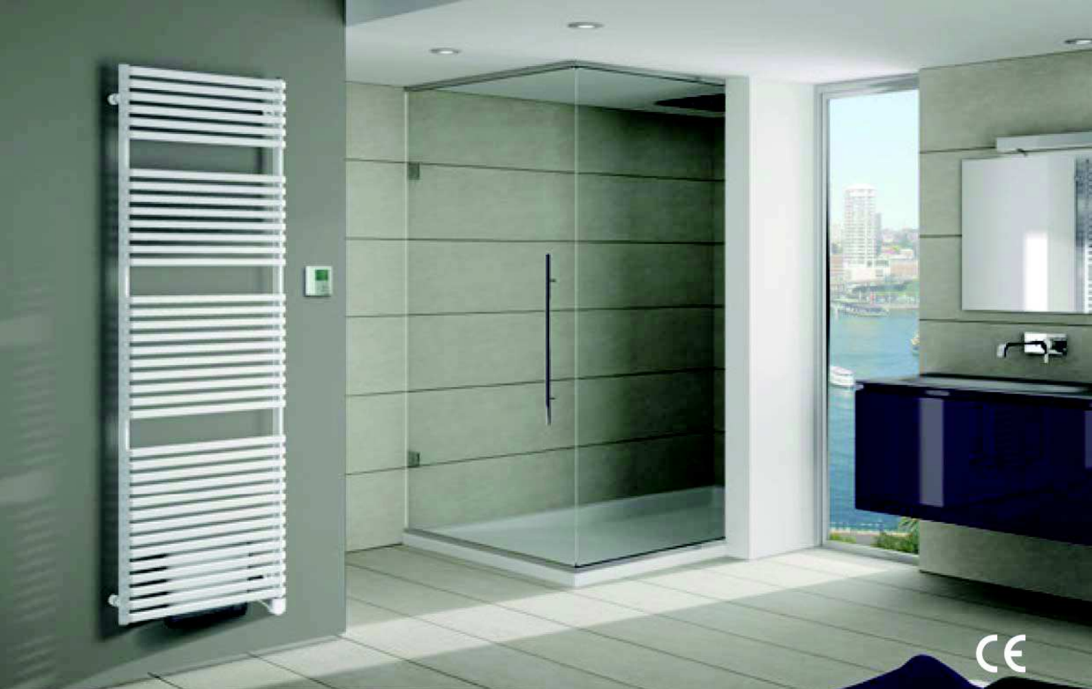
Net Air, wysokość 1760 mm, szerokość 500 mm. Wykończenie Biały Standardowy (kod 01).