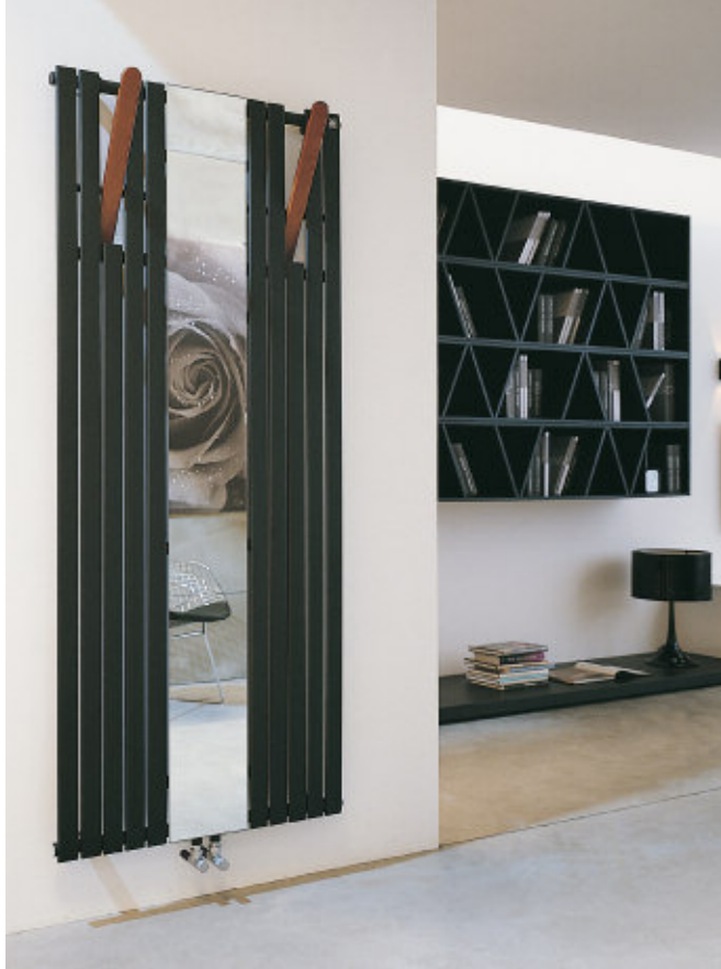
Na zdjęciu: Grzejnik Flexo 2. Wysokość 1820 mm, szerokość 788 mm, kolor Czarny Satynowany (kod. 30).