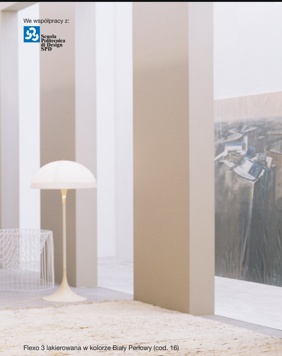
Flexo 3 lakierowana w kolorze Biały Perłowy (cod. 16)