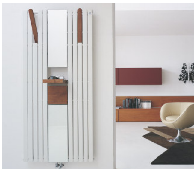
Flexo 2 lakierowana w kolorze Biały Perłowy (cod. 16)

Wersja FLEXO 2 oraz FLEXO 3 są ponadto wyposażone w środkowej części w lustro.